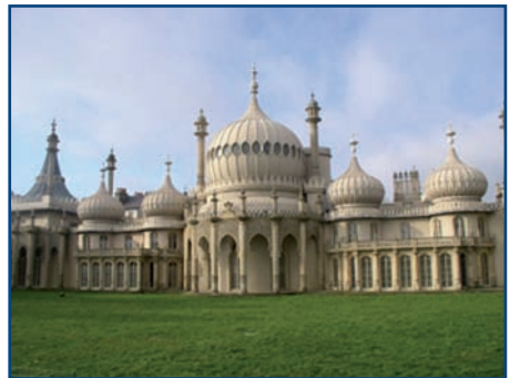
Brighton Royal Pavilion